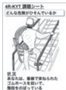
4R-KYT課題シートイメージ

課題のイラストから読み取れる不安全行動に対し、現状把握、本質追究、対策樹立、目標設定の4ステップで改善策を整理・提案する4R-KYT(4ラウンド危険予知トレーニング)は、日本の製造現場で広く知られているトレーニングです。これをグローバル安全大会などで演習することで、国内外グループ全体への水平展開を図っています。