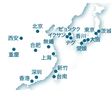
情報電子化学部門(アジア地域) 拠点図